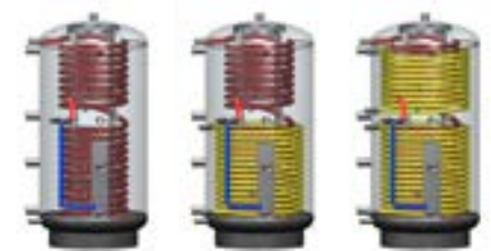
Systemspeicher mit Edelstahlwellrohr-Wärmetauscher und ohne, mit 1 oder 2 Solarregistern