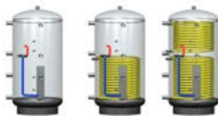
Systemspeicher ohne, mit 1 oder 2 Solarregistern