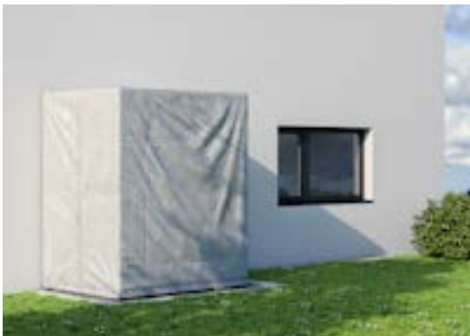
Standardausführung mit Abdeckfolie – Do-It-Yourself-ready